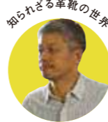
知られざる革靴の世界