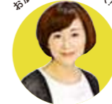
お肌のお悩みを解決!