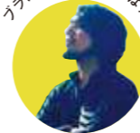
ブランド発信のコツとは?