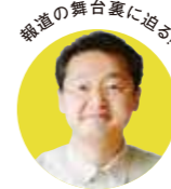
報道の舞台裏に迫る!