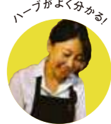
ハーブがよく分かる!