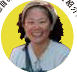
独自の視点で世界をご紹介!