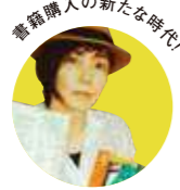
書籍購入の新たな時代!