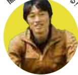
酪農の未来にふれる!