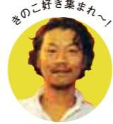
きのこ好き集まれ～!