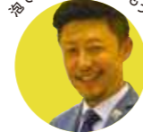
泡で優雅な秋を楽しもう!