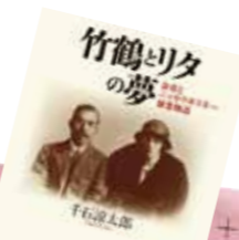
著書の1つ。朝の連ドラのテーマでも話題になった竹鶴政孝と妻リタの物語。