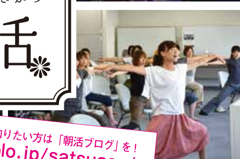
講座のことをもっと知りたい方は「朝活ブログ」を! http://ameblo.jp/satsuasa/