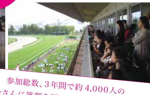
参加総数、3年間で約4,000人のみなさんに笑顔をお届けすることができました。