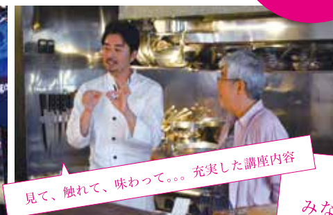
見て、触れて、味わって。。。充実した講座内容