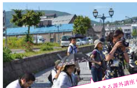
多彩な体験ができる課外講座も多数開催