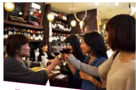
アフターパーティーは、講師と受講生がコミュニケーションをはかれる場